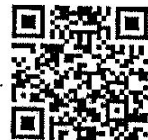
QR code ตอบแบบสอบถาม

สำนักงาน ก.ถ. กลุ่มงานกฎหมาย โทร. ๐ ๒๒๒๑ ๘๑๙๗ โทรสาร. ๐ ๒๒๒๒ ๔๑๒๙