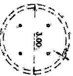
รูปแบบที่ 3 เส้นผ่าศูนย์กลาง 3.00 เมตร