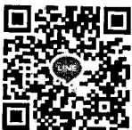
QR Code “การจัดส่งไฟล์”

สำนักงานส่งเสริมการปกครองท้องถิ่นจังหวัด