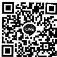
QR Code "ช่องทางจัดส่งแบบรายงาน"

สำนักงานส่งเสริมการปกครองท้องถิ่นจังหวัด