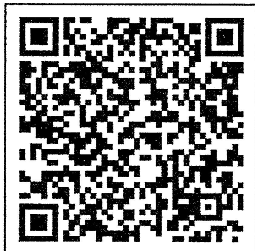
สแกน QR-Code เพื่อสมัครเข้าประกวด