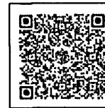
Google Form แบบประเมินฯ