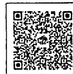
Google Form แบบสำรวจฯ