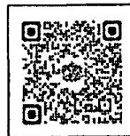
ลิงค์ส่งมาด้วย

กองตรวจสอบภาครัฐ กลุ่มงานนโยบายการตรวจสอบภาครัฐ โทร. ๐ ๒๑๒๗ ๗๐๐๐ ต่อ ๖๕๑๒ ๖๕๐๘ โทรสาร ๐ ๒๑๒๗ ๗๑๒๗ ไปรษณีย์อิเล็กทรอนิกส์ sarabani@cgd.go.th