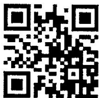
รายละเอียดสมัครอบรม