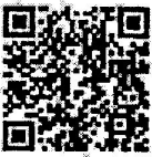
QR Code แบบรายงานข้อมูล

สำนักงาน ก.จ. ก.ท. และ ก.อบต. พิจารณาแล้ว เพื่อให้การประเมินผลงานข้าราชการหรือพนักงานครูและบุคลากรทางการศึกษาขององค์กรปกครองส่วนท้องถิ่นที่ยื่นคำขอรับการประเมินเพื่อเลื่อนวิทยฐานะสูงขึ้นระดับวิทยฐานะระดับชำนาญการพิเศษและเชี่ยวชาญ รอบเดือนตุลาคม ๒๕๖๕ ตามประกาศ ก.ท. เรื่อง หลักเกณฑ์และเงื่อนไขการประเมินผลงานพนักงานครูและบุคลากรทางการศึกษาเทศบาลเพื่อให้มีหรือเลื่อนวิทยฐานะ ประกาศ ณ วันที่ ๕ มกราคม พ.ศ. ๒๕๕๐ (มาตรฐานทั่วไปเดิม) ซึ่ง ก.จ. และ ก.อบต. กำหนดให้นำไปใช้กับองค์การบริหารส่วนจังหวัด และองค์การบริหารส่วนตำบลโดยอนุโลม เป็นไปด้วยความเรียบร้อย ถูกต้อง และเหมาะสม จึงขอความร่วมมือสำนักงาน ก.จ.จ. ก.ท.จ. ก.อบต.จังหวัด ทุกจังหวัด และสำนักงาน ก.เมืองพัทยา แจ้งองค์กรปกครองส่วนท้องถิ่นที่มีผู้ยื่นคำขอรับการประเมินเพื่อเลื่อนวิทยฐานะระดับชำนาญการพิเศษและเชี่ยวชาญ ในรอบเดือนตุลาคม ๒๕๖๕ และผ่านการประเมินด้านวินัย คุณธรรม จริยธรรม และจรรยาบรรณวิชาชีพ และด้านคุณภาพการปฏิบัติงานแล้ว รายงานข้อมูลผู้ที่จะจัดส่งผลงานที่เกิดจากการปฏิบัติหน้าที่ (ผลการปฏิบัติงานและผลงานทางวิชาการ) ต่อสำนักงาน ก.จ. ก.ท. และ ก.อบต. เพื่อกำหนดแนวในการจัดส่งให้คณะกรรมการประเมินต่อไป โดยให้รายงานข้อมูลผ่านระบบออนไลน์จากการสแกน QR Code ท้ายหนังสือนี้ และกรอกข้อมูลผู้ขอรับการประเมินรายบุคคล ภายในวันที่ ๒๘ กุมภาพันธ์ ๒๕๖๖ ทั้งนี้ สำนักงาน ก.จ. ก.ท. และ ก.อบต. จะดำเนินการรับผลงานที่เกิดจากการปฏิบัติหน้าที่ (ผลการปฏิบัติงานและผลงานทางวิชาการ) ของผู้ขอรับการประเมินดังกล่าว ในช่วงปลายเดือนมีนาคม ๒๕๖๖ สำหรับวัน เวลา และสถานที่ จะแจ้งให้ทราบอีกครั้ง