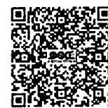
สแกนสมัครหลักสูตร ผู้บริหารงานยุวกาชาด