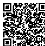
คำชี้แจง