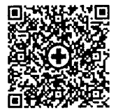
สแกนสมัครหลักสูตร ปฐมพยาบาล