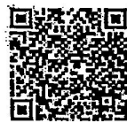
QR Code คำให้สัมภาษณ์ในรายการ เคลียร์ คัด ชัดเจน ๒๑ มี. ๖๕