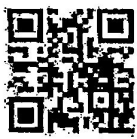
QR Code รายการเคลียร์ คัด ชัดเจน เมื่อวันที่ ๒๑ มีนาคม ๒๕๖๕