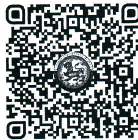
QR Code ๒ ตรวจสอบจำนวนผู้ชำระค่าลงทะเบียนแต่ละรุ่น