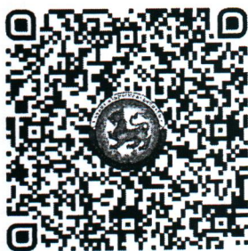
QR Code ๑ ยืนยันการเข้าร่วมอบรม