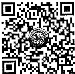
QR Code ๑ ยืนยันการเข้าร่วมการฝึกอบรม