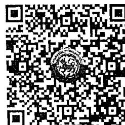
QR Code ๒ ตรวจสอบจำนวนผู้ชำระค่าลงทะเบียนแต่ละรุ่น