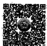
แบบรายงาน โรงเรียน ที่จัดการศึกษาระดับปฐมวัย