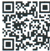
QR Code การสมัคร

๔. สถานที่รับสมัคร ลงทะเบียนออนไลน์ด้วย Google form ตาม QR Code ด้านล่างนี้เท่านั้น