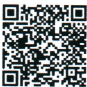
แบบสอบถาม