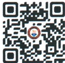
(ส่งแบบตอบรับเข้าร่วมโครงการฯ)

หมายเหตุ ให้ส่งแบบตอบรับเข้าร่วมโครงการฯ และแบบตอบรับการจองห้องพักสำรองห้องพัก โดยการ สแกนคิวอาร์โค้ดด้านล่าง ภายในวันศุกร์ที่ ๑๖ สิงหาคม ๒๕๖๗