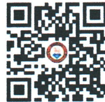
(ส่งแบบการจองห้องพัก)