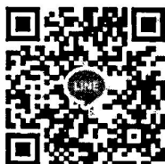
QR Code “ช่องทางการจัดส่งรายงาน”

สำนักงานส่งเสริมการปกครองท้องถิ่นจังหวัด