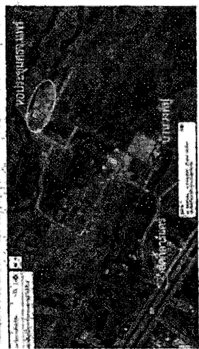
หอประชุมแม่แตง