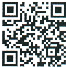
เนื้อเพลง

กองส่งเสริมและพัฒนากิจการศึกษาท้องถิ่น ฝ่ายบริหารทั่วไป