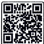
กำหนดการฝึกอบรมฯ