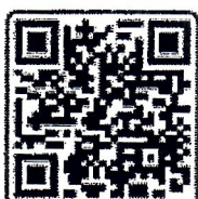
ใบแจ้งชำระเงิน