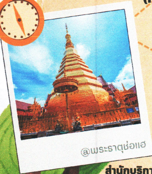
@พระธาตุช่อแฮ