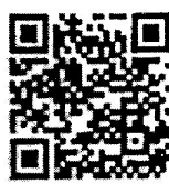
สิ่งที่ส่งมาด้วย ๓