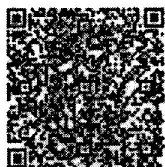
สิ่งที่ส่งมาด้วย ๑