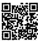
สิ่งที่ส่งมาด้วย ๒