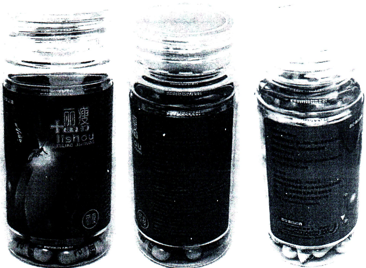
ภาพผลิตภัณฑ์...

๑. ผลิตภัณฑ์บรรจุขวดพลาสติกใสติดสติ๊กเกอร์สีฟ้าระบุข้อความภาษาต่างประเทศ "lishou FULING JIAONANG" จากร้านค้าออนไลน์ทางแพลตฟอร์ม Tik Tok Shop ร้านค้าชื่อ "Manee Wellness and Beauty"