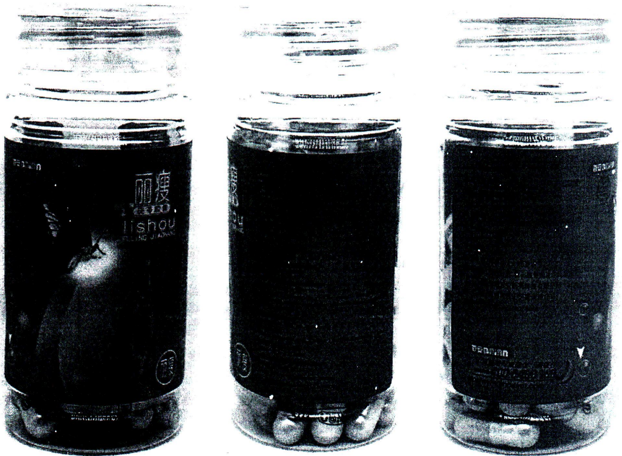
ภาพผลิตภัณฑ์...

ฉะนั้น อาศัยอำนาจตามความในมาตรา ๓๐(๓) แห่งพระราชบัญญัติอาหาร พ.ศ. ๒๕๒๒ สำนักงานคณะกรรมการอาหารและยา จึงประกาศผลการตรวจพิสูจน์อาหารให้ประชาชนทราบ ดังนี้