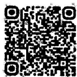
QR Code สำหรับ ดาวน์โหลดเอกสาร