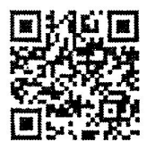
QR Code แบบสำรวจปัญหาอุปสรรค ในการ

สำนักอนามัยผู้สูงอายุ กลุ่มคุ้มครองสุขภาพผู้สูงอายุและความร่วมมือระหว่างประเทศ โทร. ๐ ๒๕๕๐ ๔๕๐๘