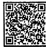
สมาคมวิศวกรรมสิ่งแวดล้อม แห่งประเทศไทย