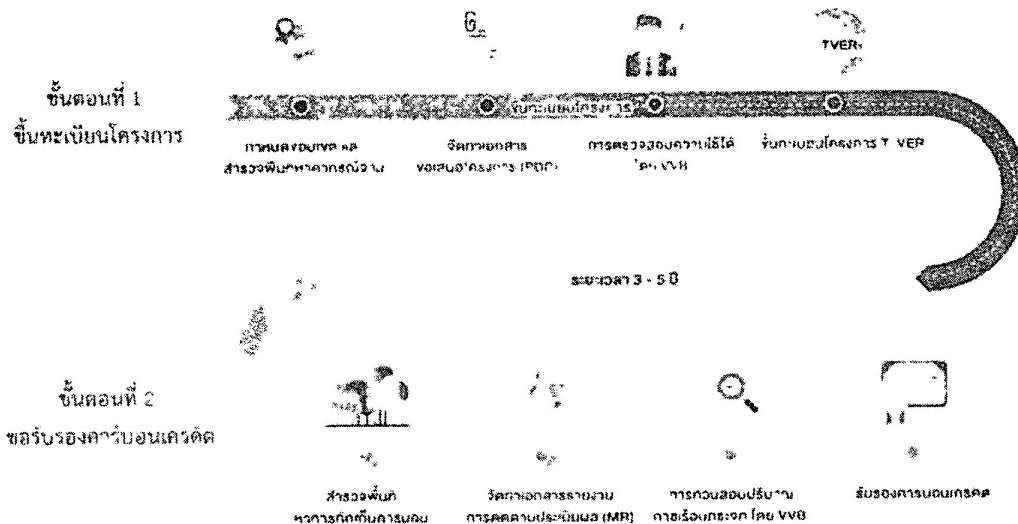
ภาพที่ 2 ขั้นตอนการดำเนินโครงการ T-VER ภาคป่าไม้

รายละเอียดเพิ่มเติม เว็บไซต์โครงการ T-VER https://ghgreduction.tgo.or.th/th/t-ver.html