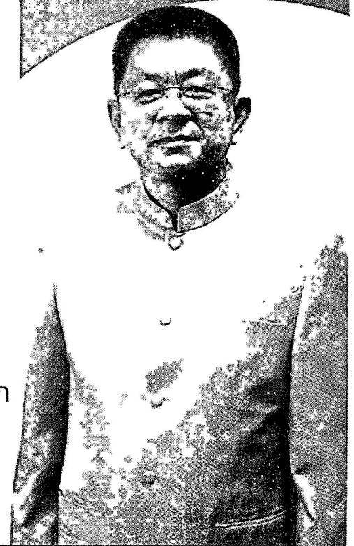
นายชอร์ ศรีชวนิชัย อธิบดีกรมส่งเสริมการปกครองท้องถิ่น

5. สนับสนุนให้อาสาสมัครท้องถิ่นรักถิ่น ร่วมกันรณรงค์ใช้กระทง 1 ครอบครัวย ต่อ 1 กระทง เลือกใช้วัสดุที่ทำจาก ธรรมชาติ ร่วมกันคัดแยกขยะ และรักษาความสะอาด