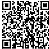
หนังสือที่อ้างถึง