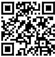
สิ่งที่ส่งมาด้วย

รองอธิบดี ปฏิบัติราชการแทน อธิบดีกรมส่งเสริมการปกครองท้องถิ่น