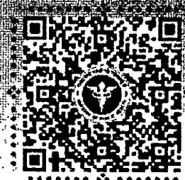
เอกสารที่เกี่ยวข้องแบบประเมิน/ใบสมัคร