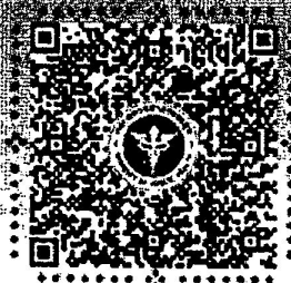
คะแนน LPA U 2566