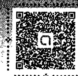
กลุ่มไลน์ EHA เขต 1

สอบถามข้อมูลเพิ่มเติมได้ที่สำนักงานสาธารณสุขจังหวัด หรือคุณพัฒนา สมารี ศูนย์อนามัยที่ 1 เชียงใหม่ โทร 084 -1759057